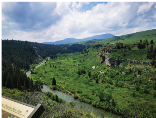
拓荒者西进路上的 Ricewille 这里这里景色优美。现在是 89 高速公路上的一个景点。