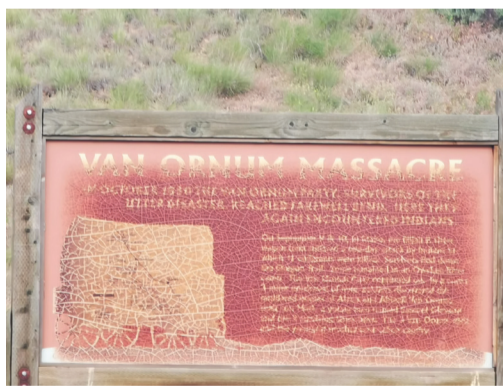
蒙大拿州发现金矿。于是怀俄明州的大角山的淘金者为了走捷径，抛开俄勒冈小道，不顾与原住民签订的协议，强行进入原住民的法定保留区，并强建军事堡垒以镇压原住民的抵抗。

1870年拓荒者与原住民发生冲突。一名拓荒者被打死。于是拓荒者出动军队把当地173名无辜的村民杀了。