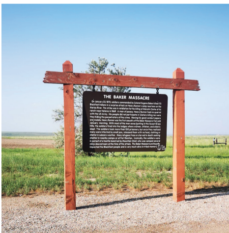
U.S. Rte 2 高速公路上的 Maker 大屠杀纪念碑。

1870年拓荒者与原住民发生冲突。一名拓荒者被打死。于是拓荒者出动军队把当地173名无辜的村民杀了。