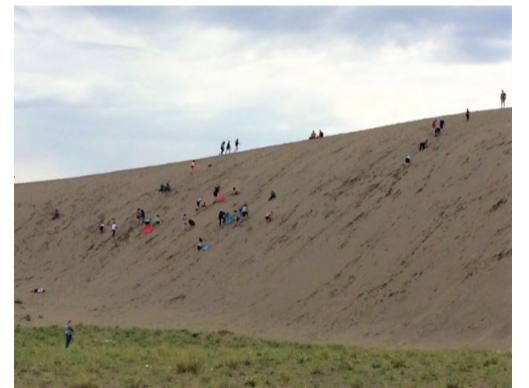
布鲁诺沙丘州立公园 (Bruneau Dunes State Park) 位于爱达荷州的南部，距离其首府车程一个小时多一点，面积4,800英亩 (大约12平方公里)。与大多数内陆盆地的沙丘不同，这里的沙丘在盆地的中部而不是边缘，而且沙丘相对分立，是所谓的单结构沙丘，其中一座高达470英尺 (140米)，雄踞北美单结构沙丘之首。

公园位于著名的蛇河 (Sneak River) 中段，大约一万五千年前，地球最后一次冰河期的末尾，北美大陆冰盖融化，这里洪水泛滥，形成东南至西北向的河谷盆地。该盆地的盛行风不是东南风就是西北风，而且它们旗鼓相当，所以从地面吹起来的沙子才会聚集在盆地的中部，而且越堆越高，达到今天的规模。