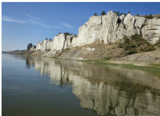
蒙大拿 Lewistown 的密苏里河。河岸边的峭壁是这里的特色。河面水流湍急。两岸土地肥沃。原住民世世代代在此居住。由于附近金矿的发现，此地的河道成了黄金水道，于是拓荒者用武力赶走了印第安人。