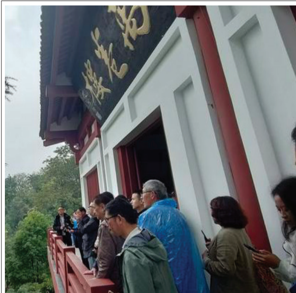
海外华文媒体参观万卷楼

陈寿治学之地万卷楼始建于三国蜀汉建兴年间，为三重檐式木石结构楼阁，飞檐斗拱，气势雄伟。至唐代又在楼前建甘露寺，形成建筑群。因年久失修，于 20 世纪