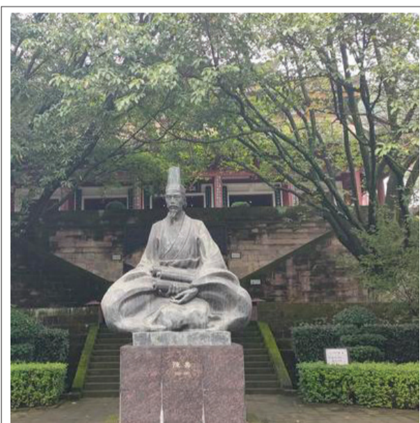
三国志作者陈寿雕像

在中华 5000 年的历史中，照理说 84 年分裂割据的三国真不是一个值得关注的时期。但由于一个人，使得三国被中国人奉为经典，更进而影响到世界。